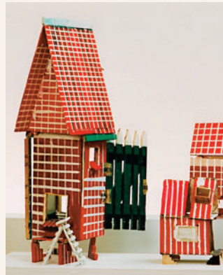
M.Gauls, Castle , Kunsthaus Kanner